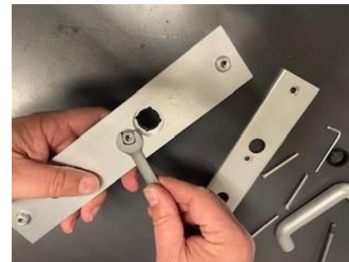
5. Draai de draadnokken uit het buitenschild (met steeksleutel 10 of waterpomptang)