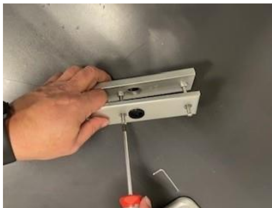
3. Draai de bevestigingsschroeven los