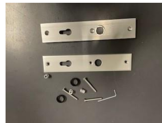
Gedemonteerd veiligheidsbeslag. Voor demontage deurkrukken zie demontage instructie deurkrukken