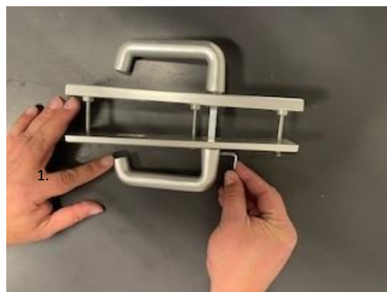
2.Draai de imbuschroef van het gatdeel los