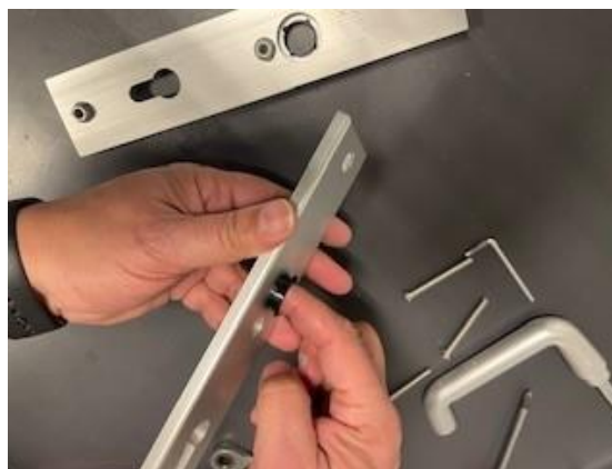
4. Druk de nylon ringen uit de schilden